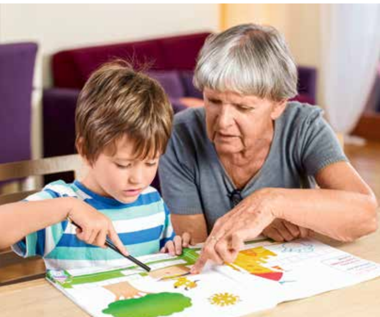
Aide aux devoirs par les seniors – la SSUP encourage la création d'institutions de prise en charge intergénérationnelle.

La pénurie de main-d'œuvre qualifiée se fait toutefois sentir dans ce domaine. Le personnel est fortement sollicité, ce qui peut expliquer la reprise tardive des rencontres intergénérationnelles. Néanmoins, neuf personnes ont participé à une offre de formation continue.