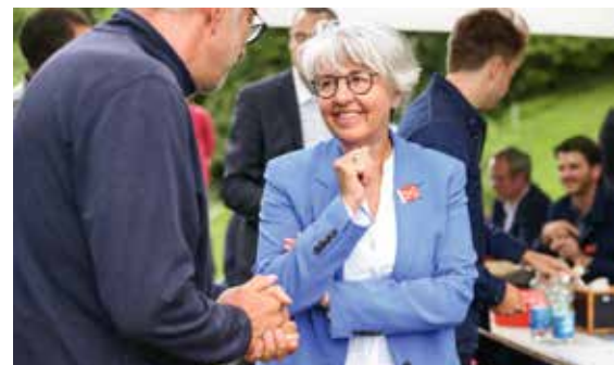
Fête fédérale sur le Grütli: en cette année de jubilé de la Constitution fédérale, le discours solennel a été prononcé par la cheffe du DFJP, Elisabeth Baume-Schneider.